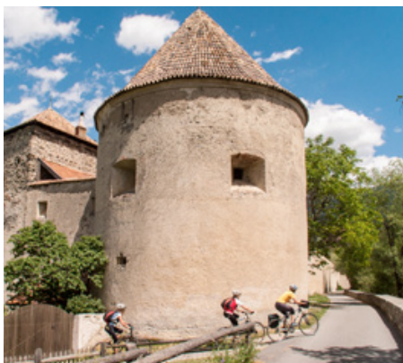
Glurns: Mittelalterliches Kleinod am Weg

» Im Mittelalter wurden die Waren aus Venedig in Mittenwald auf die bayrischen Flöße verladen. Wir verfolgen den Weg zurück und queren dabei auf historischen Wegen die Alpen. Schon der Auftakt im Karwendel ist spektakulär. Die Tour ist seit vielen Jahren ein Klassiker in unserem Programm und deshalb kennen unsere Guides jeden Geheimtipp. Wir machen Halt in den schönsten Südtiroler Buschenschänken und genießen italienischen Flair im alten Palazzo in Trient. Der perfekte Einstieg. «