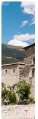
Die Power der Gruppe hilft über den Berg