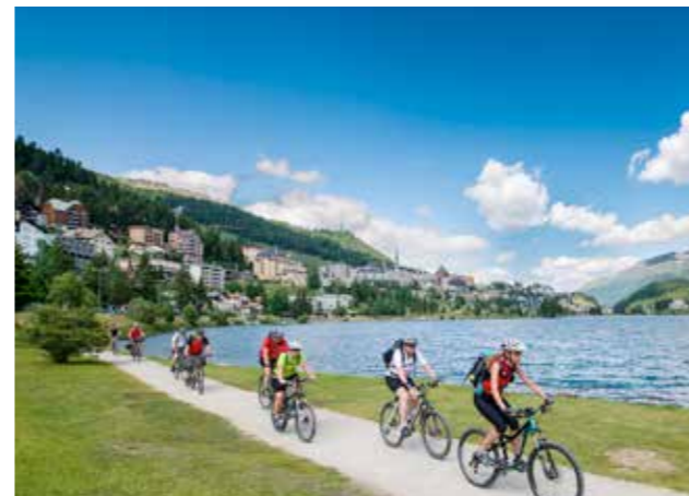
Schönste Bergwelt im Engadin