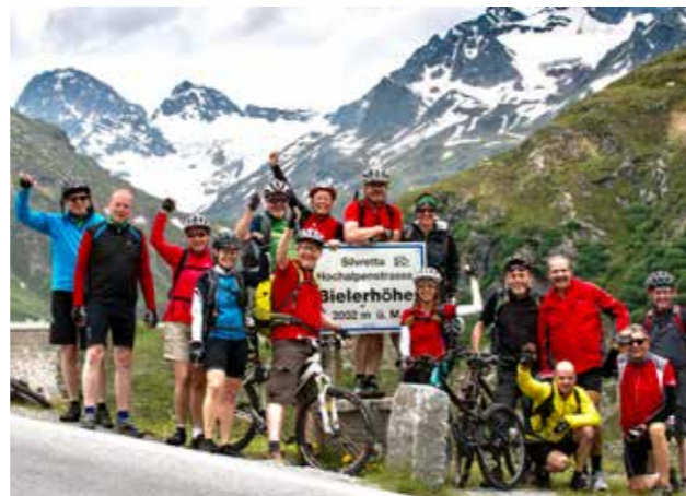
Gruppen-Glück auf der Passhöhe