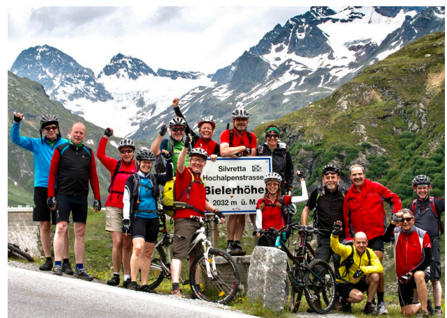
Gruppen-Glück auf der Passhöhe