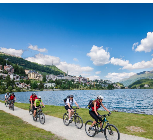
Schönste Bergwelt im Engadin