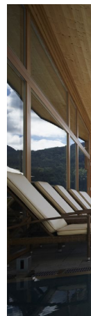
Start im schönsten Oberbayern