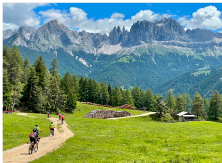
Postkarten Motiv am Rosengarten