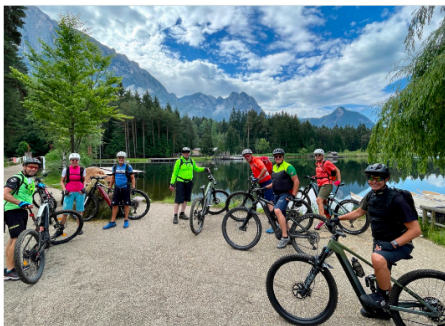
Herrlich am Völser Weiher