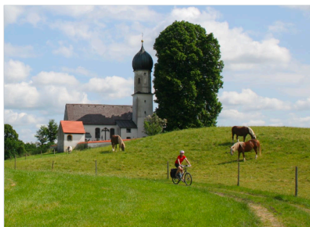
Start im schönsten Oberbayern