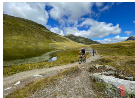
Täglich hochalpines Gelände