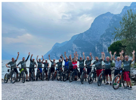
Glückliche Finisher am Lago