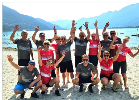
Ankunft am Lago Maggiore