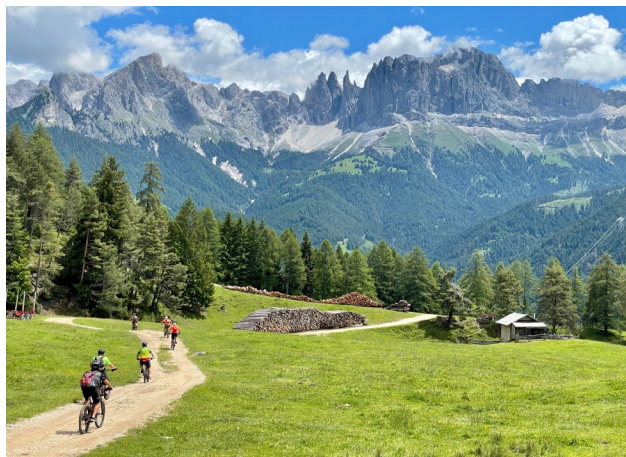
Postkarten Motiv am Rosengarten