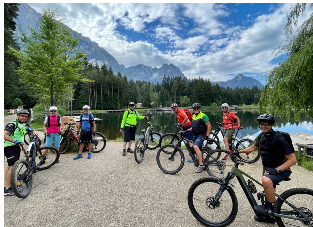
Herrlich am Völser Weiher