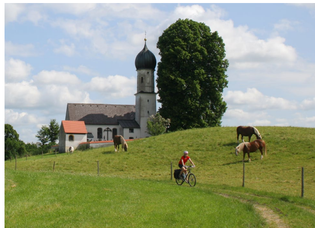
Start im schönsten Oberbayern