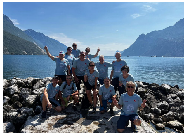
Glückliche Finisher am Gardasee