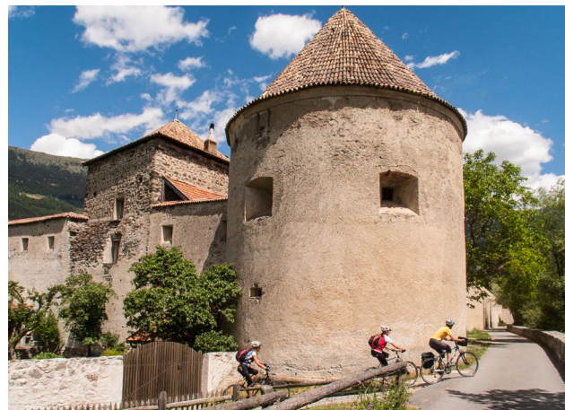
Glurns: Mittelalterliches Kleinod am Weg