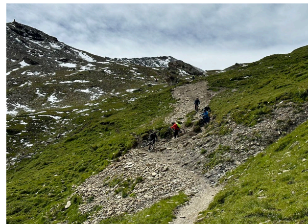
Hochalpine Strecken wie hier am Fimbapass