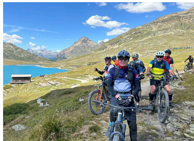
Gelungene Premiere 2023